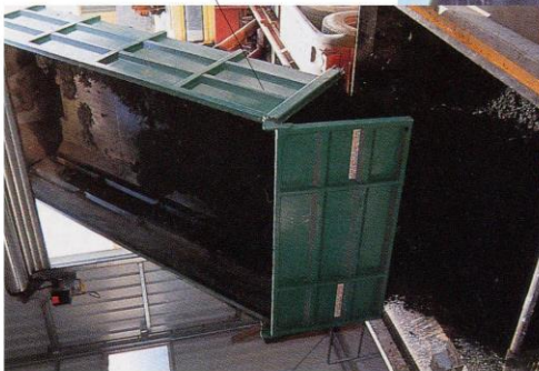
Annahmehunker in einer Halle mit Rolltor