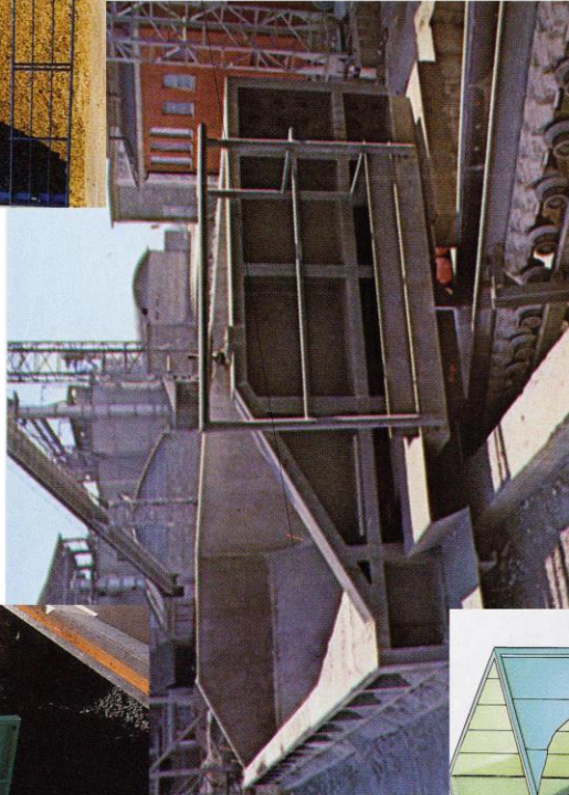
Prinzipdarstellung eines Annahmehunkers für LKW mit Schubrost und Schneckenförderer