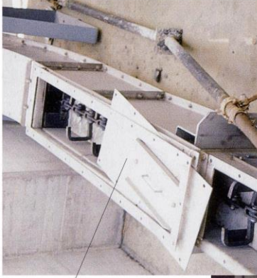
Behälteraustrag mit Zellenrad- schleuse und Schnecken- förderer