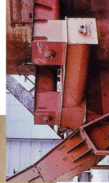
Behälteraustrag mittels Schnecken und Trogkettenförderer